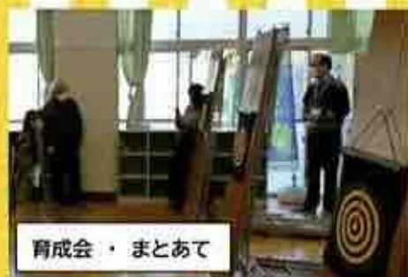
育成会・まとあて