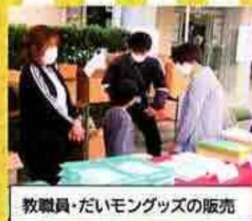
教職員・だいモングッズの販売