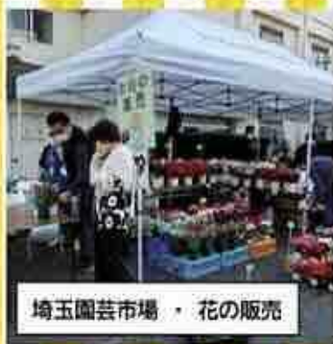
埼玉園芸市場・花の販売