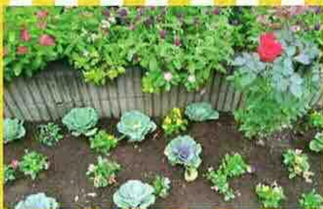
花の種類 『ピオラ・よく咲くスマレ・葉ぼたん』