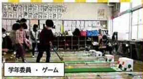
学年委員・ゲーム