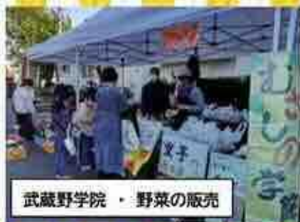
武蔵野学院・野菜の販売