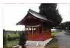
見沼井財天・中間点6.5km