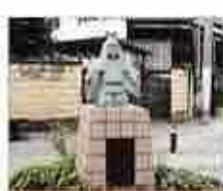
わらべ像11km ここから右側通行