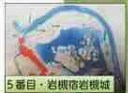
5番目・岩槻宿岩槻城