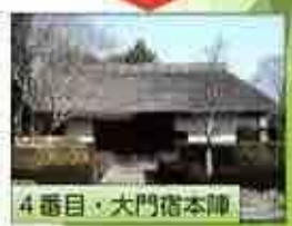
4番目・大門宿本陣